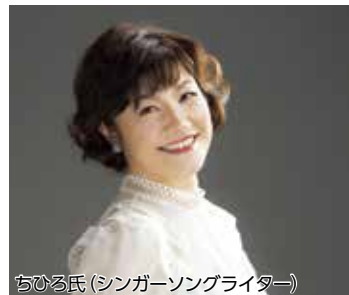
ちひろ氏(シンガーソングライター)