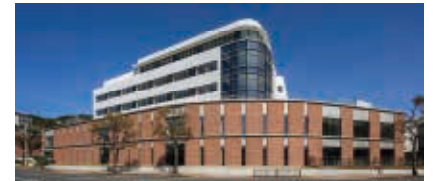
第 22 回都市景観賞 大きな建物部門