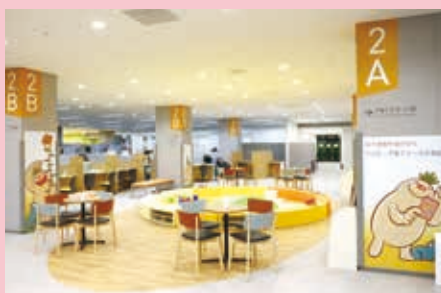
市役所 2 階 イーカオプラザ