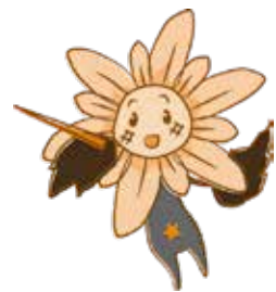
長崎市人権イメージキャラクター ヒマワリさん

今年度は長崎市内の小中学校から、4,016点の応募があり、その中から審査によって最優秀作品2点、特選25点、入選63点、計90点が選ばれました。