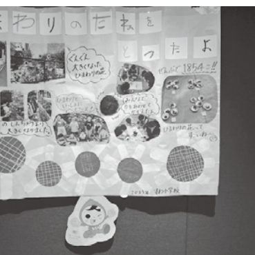
学校が人権について学んだ成果です