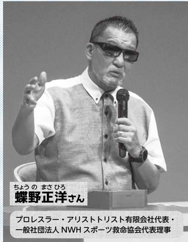
ちょうの まさひろ 蝶野正洋さん

プロレスラー・アリストロリスト有限会社代表・ 一般社団法人NWHスポーツ救命協会代表理事