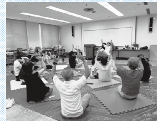
アマランス利用登録団体主催講座 「長崎のパパたちよ もっと育児力を 上げよう」開催様子

○講座「ヤングケアラーと「子どもの権利」～まずは知ることから始めよう～」では、ヤングケアラー当事者より、現状を踏まえ、まずは「ヤングケアラーについて知る」をテーマとしたお話をいただきました。