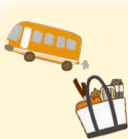
水の浦地区で実施した初めてのお買い物バス