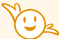
長崎市社協公式キャラクター 「ピー助」

長崎市社会福祉協議会は、「誰もが⑤だんの ④らしのなかで①あわせを感じられる笑顔 あふれるまち“ながさき”」を目指し、令和6 年度はこれらの事業に取り組んでまいります。