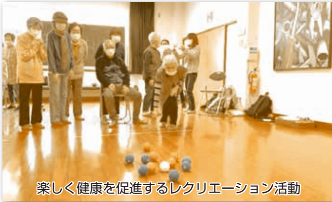
楽しく健康を促進するレクリエーション活動