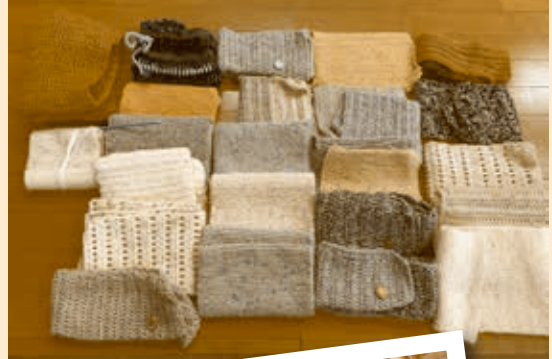
作り手の温かい気持ちがこもったネックウォーマー

※社協支部は、団体を結びつけることで、団体同士の協力や連携を行い、住みやすいまちづくりを目指して活動しています。