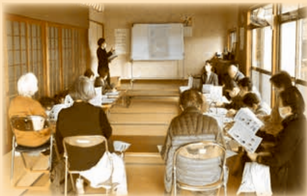
星取公民館で実施したスマホ教室の様子