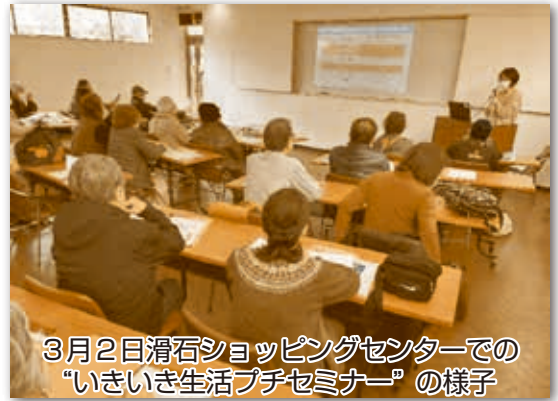
3月2日滑石ショッピングセンターでの “いきいき生活プチセミナー”の様子

市社協の生活支援コーディネーターは、各地域にある高齢者の“集いの場”に向けて、さまざまな支援活動を提供しています。例えば、ボッチャやラダーゲッターといったレクリエーション機材の貸し出しや競技の指導を行っています。活動を通じて、参加者の健康を促進し、同時に他者との交流を深めています。