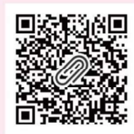
【子育てお役立ちリンク集】

長崎市の子育て支援事業等の詳細は 子育てお役立ちリンク集 で確認できます！ イーカオにも掲載させていただきます。