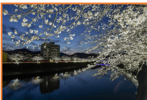
＜トワイライト桜と八郎川＞