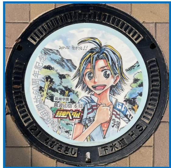
【箱根学園 真波 山岳】

長崎市の「下水道供用開始60周年をPRすること」及び「アニメツーリズムによる観光客の誘致と市内全域の周遊促進を図ること」を目的として、大人気漫画「弱虫ペダル」と長崎市がコラボし、弱虫ペダルのキャラクターが描かれたデザインマンホールが制作・設置されました。