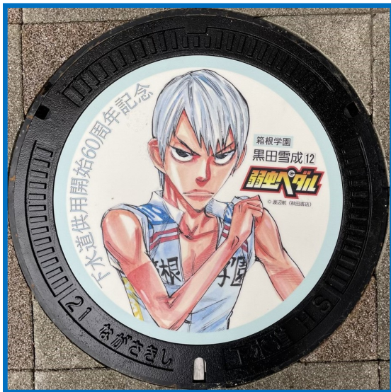
【箱根学園 黒田 雪成】