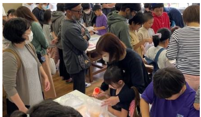
靴下染めのモノづくり体験