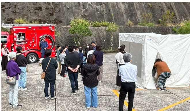
煙ハウスの消防体験

11月17日、虹が丘小学校で「令和6年度レインボーフェスティバル」が行われました。小学校の生徒が学年ごとに合唱や総合学習、劇などを発表する中、学童クラブによる太鼓の演奏もあり、来場者からは温かい拍手が送られていました。また、コマ回しなどの昔遊びの体験や靴下染めのモノづくり体験、消防体験も行われ、地域の方々と交流を深めていました。