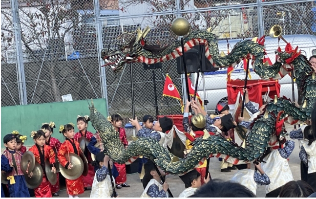
大人顔負けの迫力ある演技!

11月30日、平宗公園で「滑石っ子ふれあい祭り」が開催されました。前日まで雨模様でしたが、当日は天候が回復し、幅広い世代の方の来場がありました。長崎北保育園の龍踊りや滑石小学校合唱部による合唱、長崎工業高校による演奏・マーチングなどのステージイベントで祭りを盛り上げました。バザーや綿菓子、フルーツなどの出店や昔遊び等のブースも賑わいを見せ、大いに盛り上がった一日となりました。