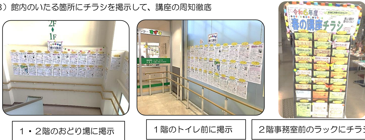
1・2階のおどり場に掲示