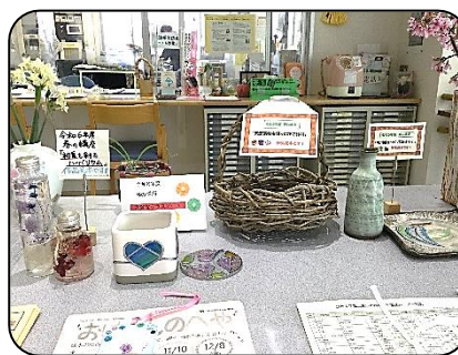
制作する作品の見本展示