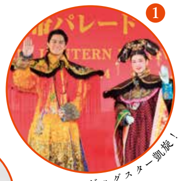
ビッグスター凱旋!