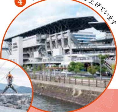
市も一緒にまちを盛り上げています