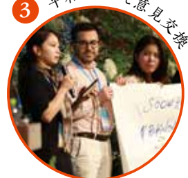
平和について意見交換