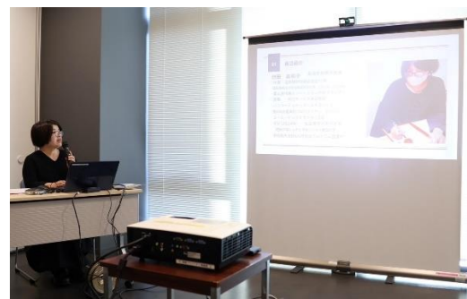
活動報告会の様子

私が企画した「幕末珈琲タイムトリップ高島」が、全国の特産品や観光プランを競う大会「にっぽんの宝物グランプリ」で審査員特別賞を受賞しました！この企画は、春や秋に高島を訪れる観光客を増やすことが目的の体験型観光プログラムで、ポイントは3つです。