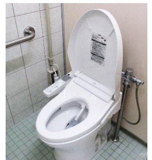
高島海水浴場のトイレは温水洗浄便座付きの洋式トイレになりました。

高島海水浴場管理棟内の和式トイレが、温水洗浄便座がついた洋式トイレになり、より快適に利用できるようになりました。