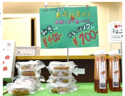
直売所での販売の様子(右は「酵素ドレッシング」、左は「おかず味噌」)

今年のトマトの生育は例年よりも少し早いそうで、いつもなら3月下旬から「ハートの女王」が収穫され始めるのですが、今年は3月中旬には収穫、販売できるようになるかもしれないとのことでした。