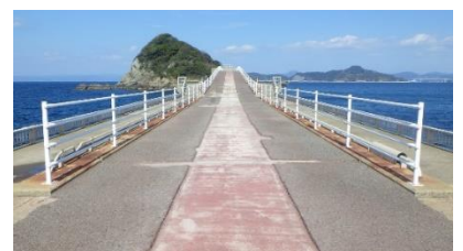
飛島磯釣り公園の南側釣台はキャリーカートが通りやすくなりました。

飛島磯釣り公園南側釣台(高島と飛島をつなぐ橋の部分)の手摺が取り替えられました。また、橋の中央には凸凹の少ない道がつけられ、クーラーボックスなどを運ぶキャリーカートがこれまでよりもスムーズに通れるようになりました。