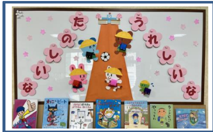
「児童コーナー」の掲示板