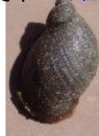
ハブタエモノアラガイ 外来種