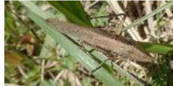
シブイロカヤキリ