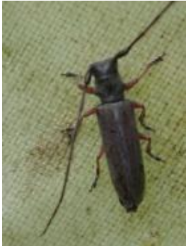
キクスイモドキカミキリ