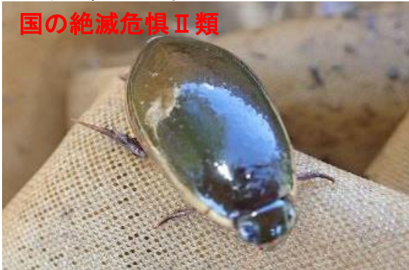
コガタノゲンゴロウ