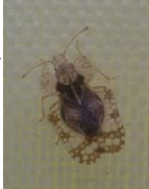
アワダチソウグンバイ