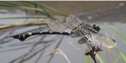
台湾ウチワヤンマ