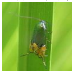
ツマキホソハマキモドキ