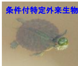
ミシシippアカミガメ(ミドリガメ)