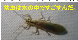
フタツメカワゲラの仲間