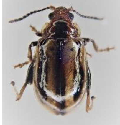
タマアシトビハムシ