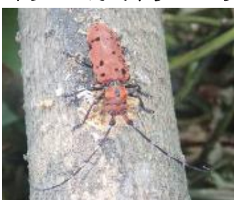
ホシベニカミキリ