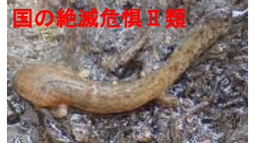
カスミサンショウウオ(幼生)