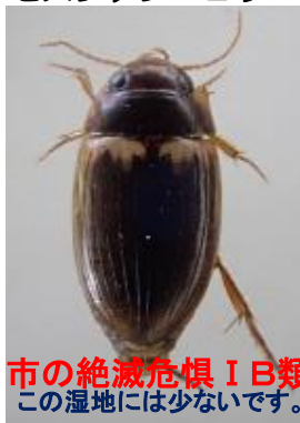
セスジゲンゴロウ