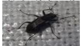
キスジミゾドロムシ