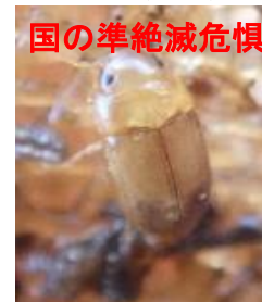
チビマルケシゲンゴロウ