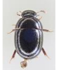
ヒメセマルガムシ