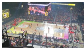
※写真は船橋市の事例