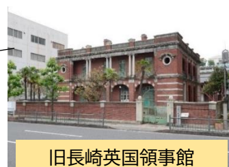
旧長崎英国領事館