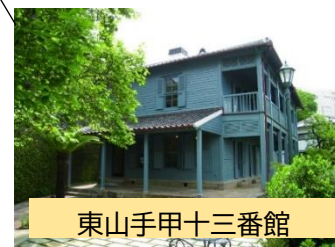
東山手甲十三番館