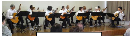
クラシックギター