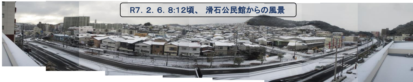
R7. 2. 6. 8:12頃、滑石公民館からの風景