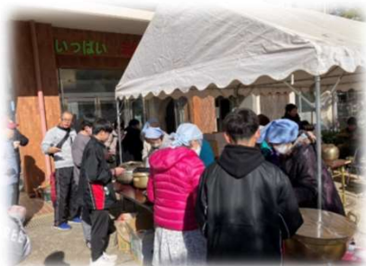
カレーライス どうぞ..