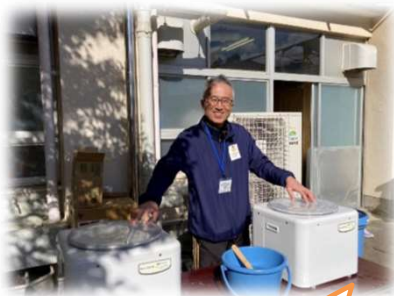
電動もちつき機を 使って、さらに..