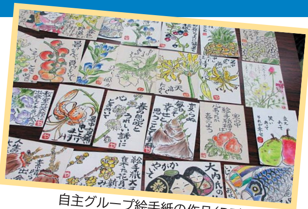
自主グループ絵手紙の作品(P7)