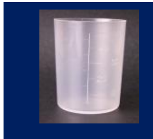
ポリコップ（目盛付き）

洗口するコップはプラスチック製又は紙製のものを使用します。各自が歯磨き等で使用しているコップでも構いません。使用後の洗浄、管理は施設や園児の実情にあわせ、担当者が適切に指導・管理します。