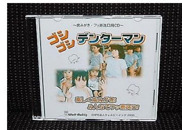
NPO 法人ウェルビ〜イング 音楽 CD ※歯磨き用とフッ化物洗口用の2曲

タイマーや砂時計は1分間ブクブクうがいをするときの時間を計測します。また、洗口をしている間に音楽を流したりするのもおすすめです。オリジナルなものを使われるのもいい方法と思われます。