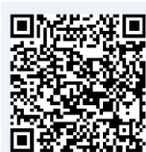
「フッ化物洗口のページ」

様式は、全て市からお送りします。また、長崎市のホームページ「フッ化物洗口のページ」・二次元コードからダウンロードできます。