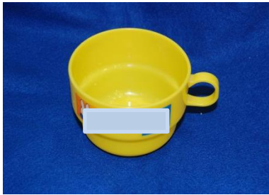
プラスチックコップ