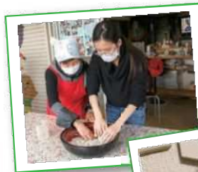
琴海 そば打ち体験 食品サンプル製作体験