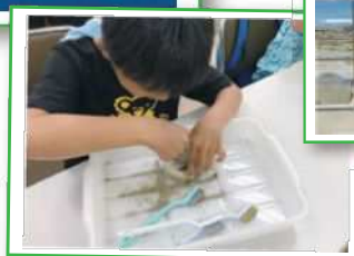
野母崎 子どもチャレンジ 2025