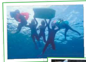
高島 シュノーケリングピクニック ファミリーサマーキャンプ in 高島