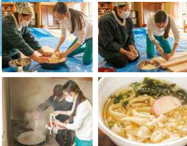
外海では作上り(田植えや収穫など全ての仕事を終えること)に、各家庭でうどん打ちをする風習があったんだとか。美食ではおかわりする人が続出、皆で作るうどんは本当に美味しい!

外海産の小麦を使用し、水回し・練り・延し・切り…と一連の流れを実体験! 腰を使って、力を入れて、地元の方が手取り足取り優しく教えてくれます。できあがった後はもちろん美食タイム!