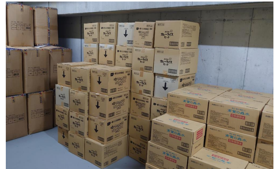
※ 長崎スタジアムシティ内備蓄倉庫

被災者の生活の維持のため必要な食料、飲料水、燃料、毛布等の生活必需品等を効率的に調達・確保し、ニーズに応じて供給・分配を行えるよう、新物資システム(B-PLo)等を活用して施設(備蓄倉庫・物資拠点・避難所)ごとの備蓄物資の品目・数量や施設の概要等の情報を定期的に更新し、最新の状況を把握する。また、備蓄状況については、年に1回、広く住民に公表する。