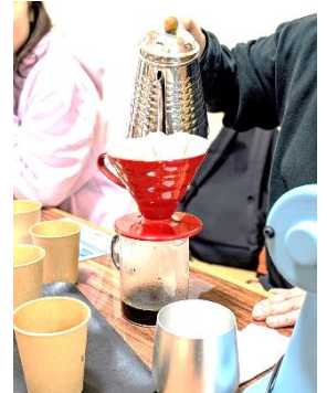
ハンドドリップに挑戦!

これからも、コーヒーをきっかけに地域の皆さんが気軽に集まり、ホッとできるような交流の場づくりに取り組んでまいります。