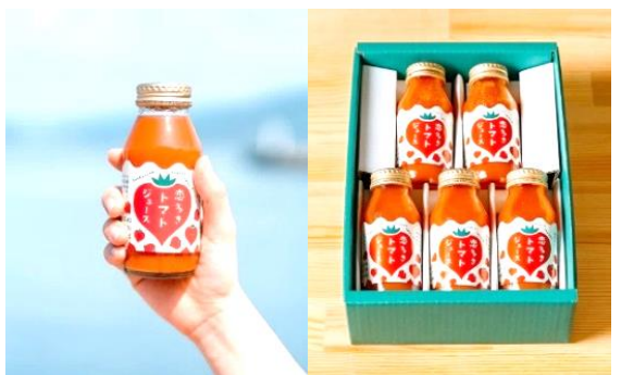
新発売の180ml入り「恋多きトマトジュース」 ※ 5本セット(写真右)もあります。

また、4月上旬、2日間にわたって、崎永海運(株)の新人研修が行われ、新入社員が農作業に勤しんだとのことでした。