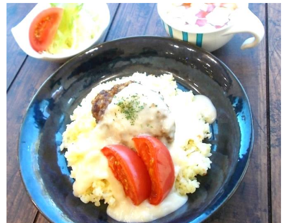
市役所内のレストランで提供された「たかしまフルーティートマトのデミセック(「デミ」は半分、「セック」は乾燥という意味のフランス語)を添えた自家製ハンバーグ パターライス クリームソースがけ

4月17日(金)、市役所内のレストランでは、この日だけの数量限定ランチメニューとして、高島トマトを使った料理が提供されました。また、店頭では高島トマトの販売も行われました。