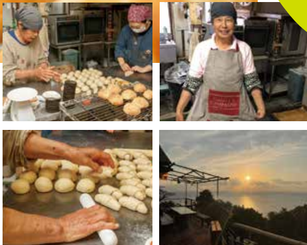
発酵したパン生地をこねて成形して…。できあがったパンは、スープ・サラダと一緒にカフェで美食。焼きたてのふわあつと立ち上がる湯気と香りが食欲をそそる～

■ 料金 / 2,500円/人 ■ 時期 / 通年/午前10時～約3時間 ■ 定員 / 4～8人 関 平ベーカーリー TEL:0959-25-0598 長崎市赤首町446