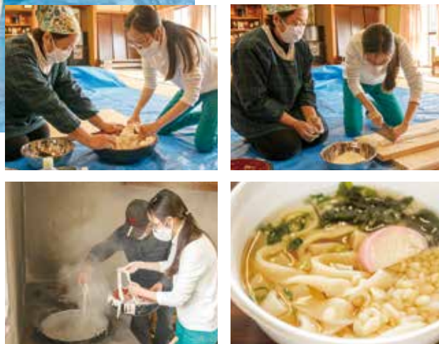
外海では作上り(田植えや収穫など全ての仕事を終えること)に、各家庭でうどん打ちをする風習があったんだとか。美食ではおかわりする人が続出、皆で作るうどんは本当に美味しい!

外海産の小麦を使用し、水回し・練り・延し・切り…と一連の流れを実体験! 腰を使って、力を入れて、地元の方が手取り足取り優しく教えてくれます。できあがった後はもちろん美食タイム!